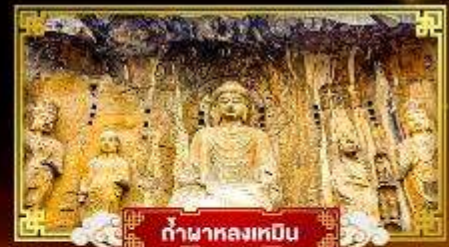
กำแพงหลงเหมิน