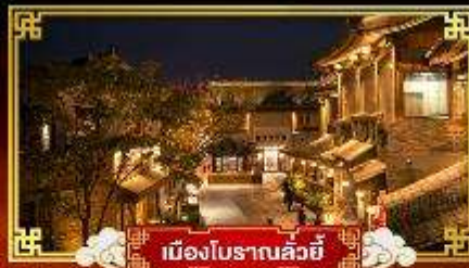
เมืองโบราณลั่วหยี่