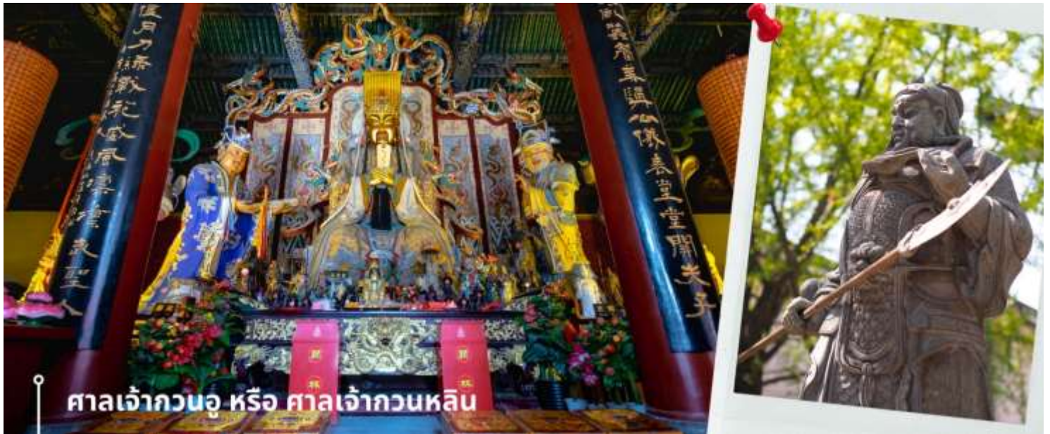
ศาลเจ้ากวนอู หรือ ศาลเจ้ากวนหลิน

นำท่านเดินทางไปยัง ศาลเจ้ากวนอู หรือ ศาลเจ้ากวนหลิน ในเมืองลั่วหยาง ตั้งอยู่ทางใต้ของเมืองลั่วหยาง มีประวัติศาสตร์กล่าวว่าที่นี่เป็นสถานที่ฝังศพของแม่ทัพกวนอู ผู้จงรักภักดีในสมัยพระเจ้าฮั่นเหี้ยนเต้ ก่อนถึงตำแหน่งที่ ประดิษฐานเทพเจ้ากวนอู จะมีแนวต้นไม้และสิ่งโศกหินจำนวน 104 ตัว ตั้งเรียงรายอยู่สองข้างทางเดิน พร้อมผ้าสีแดงสด เขียนคำอวยพรผูกอยู่กับตัวสิ่งโศก รวมถึงยังมีแผ่นกระดาษให้เขียนขอพรและนำไปแขวนไว้ตามกิ่งไม้