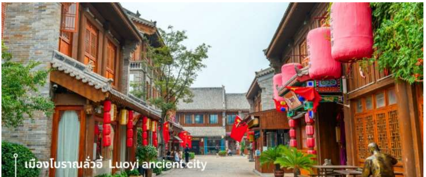
เมืองโบราณลั่วอี้ Luoyi ancient city

นำท่านเที่ยวชม เมืองโบราณลั่วอี้ เป็นสถานที่ท่องเที่ยวระดับ 1A ตั้งอยู่ในเมืองเก่าของเมืองลั่วหยาง เมืองหลวงโบราณของราชวงศ์ทั้ง 13 ราชวงศ์ บรรยากาศคอบอวลไปด้วยเสน่ห์แบบจีนโบราณ ที่ยังคงอยู่มายาวนานหลายร้อยปี เมื่อเดินเล่นผ่านเมืองโบราณลั่วอี้ จะเห็นสถาปัตยกรรมบ้านเรือน ที่มีชายคาซ้อนกันเป็นชั้นๆ และกำแพงเมือง สนามหญ้า