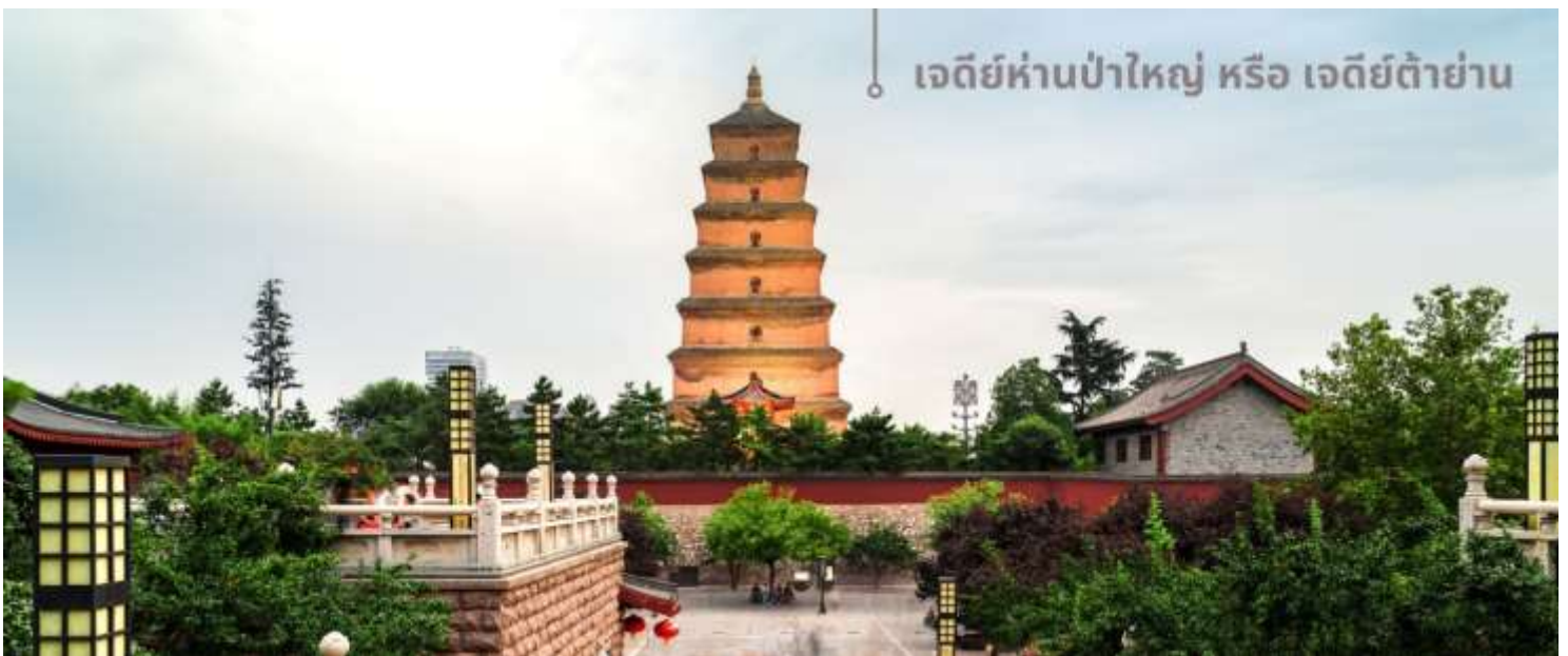
เจดีย์ห่านป่าใหญ่ หรือ เจดีย์ตั๋ย่าน

จากนั้นนำท่านเที่ยวชม เจดีย์ห่านป่าใหญ่ หรือ เจดีย์ตั๋ย่าน สถานที่ท่องเที่ยวระดับ 4A อายุมากกว่า 1,300 ปี ตั้งอยู่ในบริเวณวัดต้าฉือเอิน ซึ่งเป็นวัดสำคัญที่พระถังซำจั๋งเคยพำนัก ในตอนใต้ของเมืองซีอาน มณฑลฉ่านซี ตัวเจดีย์สร้างขึ้นใน ค.ศ.652 ในสมัยราชวงศ์ถัง โดยพระถังซำจั๋ง(หรือพระเสวียนจ้าง) ได้เสนอให้สร้างขึ้นเพื่อเก็บพระคัมภีร์และวัตถุที่ได้นำกลับมาจากชมพูทวีปในช่วงการเดินทางไปแสวงบุญที่อินเดีย เจดีย์ห่านป่าใหญ่มีความสูงประมาณ 64 เมตรในปัจจุบัน หลังผ่านการบูรณะและปรับปรุงหลายครั้ง โครงสร้างของเจดีย์ทำจากอิฐและมีการออกแบบที่เรียบง่ายแต่สง่างาม แสดงถึงสถาปัตยกรรมสมัยราชวงศ์ถัง แต่ด้วยเหตุแผ่นดินไหวในเวลาต่อมา บางส่วนของเจดีย์ถล่มลง ทำให้ปัจจุบันเหลือเพียง 7 ชั้นเท่านั้น ส่วนที่มาของชื่อเจดีย์ ตำนานเล่าว่ามีพระสงฆ์ในกลุ่มหนึ่งที่นับถือลัทธิแบบมหายาน เคยขาดแคลนอาหารอย่างหนัก วันหนึ่งพระสงฆ์เห็นฝูงห่านป่าบินผ่าน สงฆ์บางคนอธิษฐานต่อพระพุทธเจ้าให้พวกเขาได้รับอาหารเพียงพอสำหรับดำรงชีวิต ทันใดนั้น ห่านป่าตัวหนึ่งตกลงมาจากท้องฟ้าชนเข้ากับเจดีย์ ถึงแก่ความตาย เหล่าพระสงฆ์เชื่อว่าเป็นการสละร่างให้เป็นอาหาร จึงเชื่อกันว่าห่านตัวนั้นคือสัญลักษณ์ของพระเมตตา บ้างก็ว่าห่านตัวนั้นคือพระโพธิสัตว์ จึง