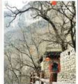
หมู่บ้านถ้ำเอ๋อโป