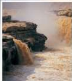
น้ำตกหูโข่ว