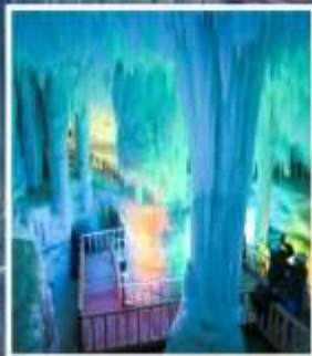
ถ้ำน้ำแข็งอวิ้นชีวซาน