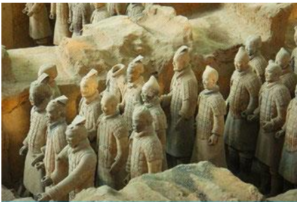
สุสานกองทัพทหารม้าจินซี

พักที่ XINYUAN HOTEL 4* หรือ โรงแรมในระดับเดียวกัน เมืองหัวซาน