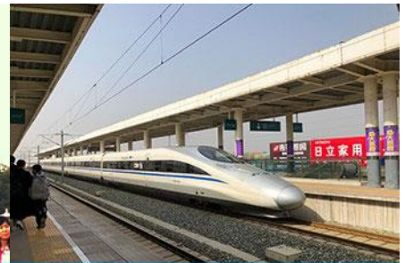
นิ่รถไฟความเร็วสูง