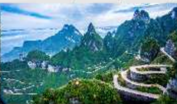
ถนน 99 โค้ง