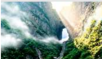
ประตูละคร