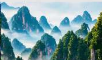
เขาวงตาร

*ทางบริษัทฯ ขอสงวนสิทธิ์ในการสลับโปรแกรมทัวร์ตามความเหมาะสมขึ้นอยู่กับสถานการณ์ปัจจุบัน โดยทำมิ่งถึงผลประโยชน์ของลูกค้าเป็นสำคัญ