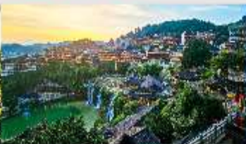
เมืองโบราณฝูหรงเจิน