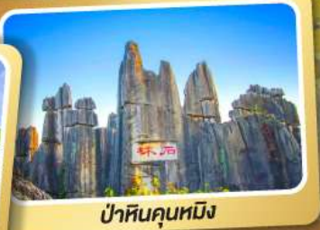
ป่าหินคุณหมิง