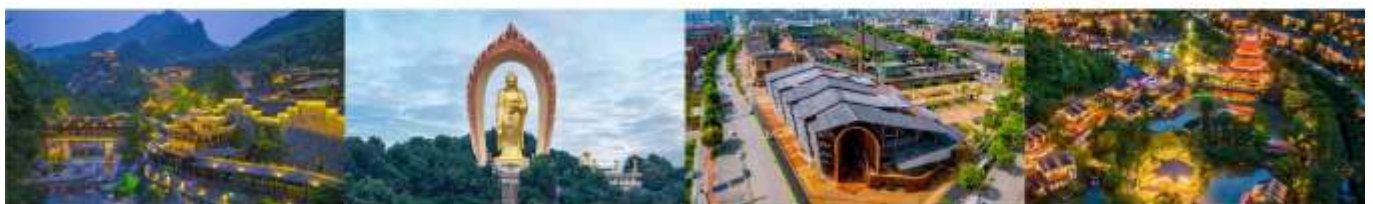
หุ่นเขาเทวดาวิ่งเซียนทู่