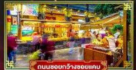
ถนนชอว์กวางชอยแคบ