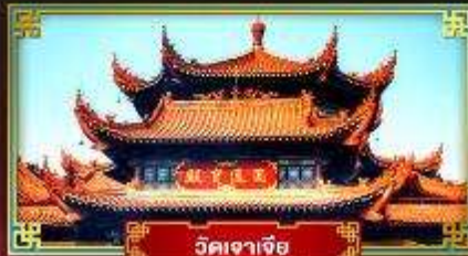
วัดเจเจีย