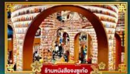
ร้านหนังสือจขงชว่เก๋อ