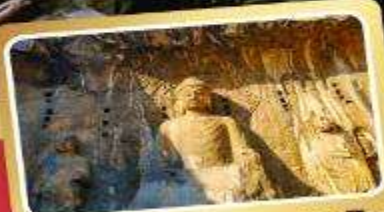
ผาแกะสลักหลงเหมิน