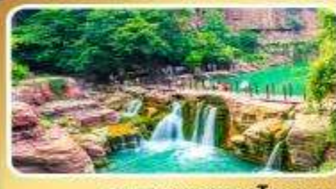
อุทยานหยุ่นโกซ่าน