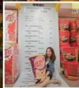
SNACK BUSY STATION