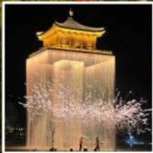
อู๋นวิโจว