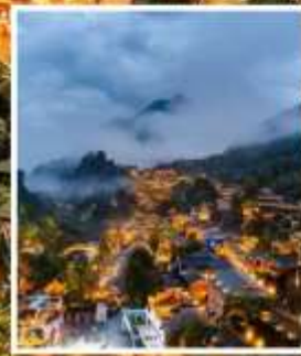
หมู่บ้านเกอต้าวังเซียนกู่