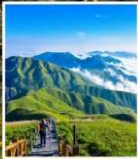
เขาอู่กงซาน