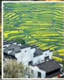
หมู่บ้านโบราณหวงหลิ่ง