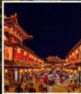
ถนนคนเดินว่านโซ่วกง