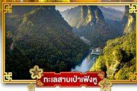
ทะเลสาบเป่าเฟิงหู