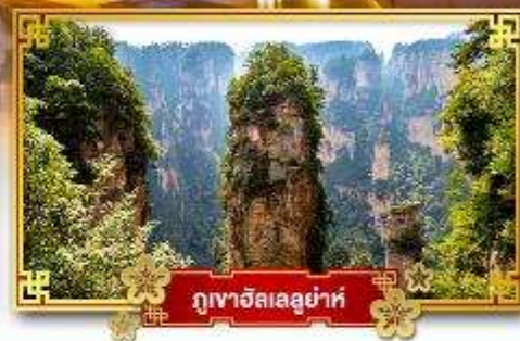
ภูเขาอัลเลอูย่าห์