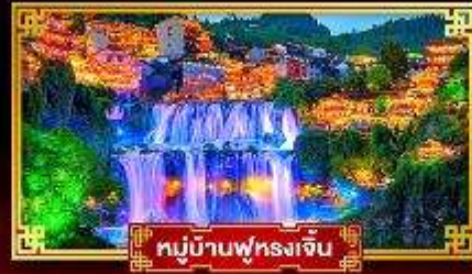
หมู่บ้านฟุรงเจิน