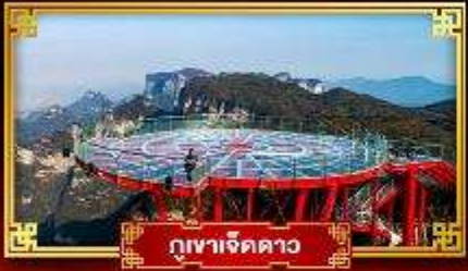
กุเขาเจ็ดดาว