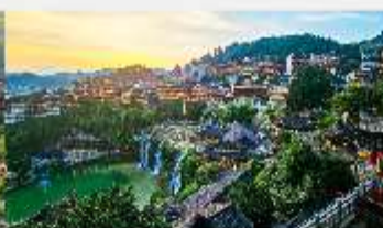
เมืองโบราณฟูหรงเจิน