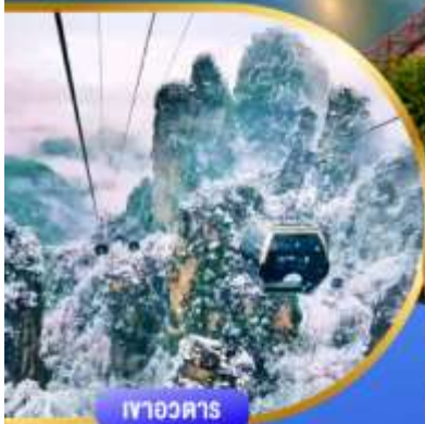
เทาอวดตาร