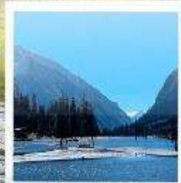
อุทยานหวงเจียวโกว