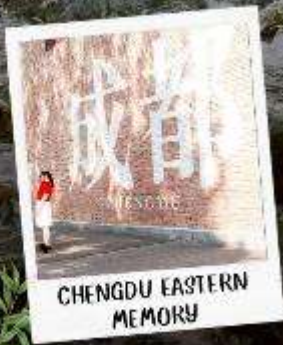
CHENGDU EASTERN MEMORY