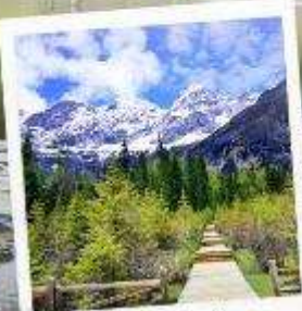
อุทยานภูเขาสี่ตรุณี