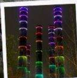
แสง สี ห้าง SKP