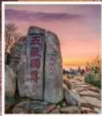
หินแกะสลักในสมัย ราชวงศ์ถัง