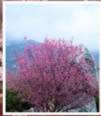
ชมดอกท้อภูเขาไถ่ซาบ