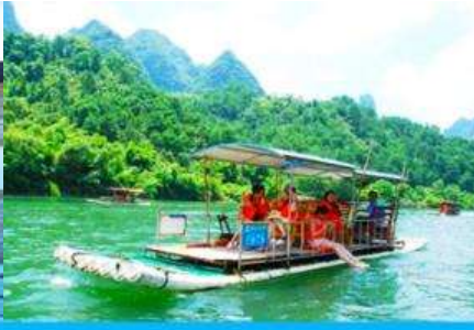
ล่องแพไม้ไผ่