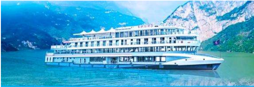
ล่องเรือชมเขื่อนสามผา