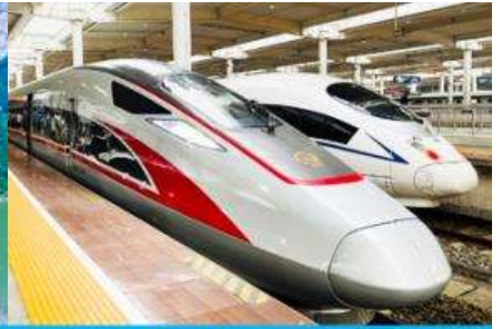
นั่งรถไฟความเร็วสูง