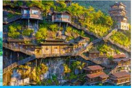
อุทยาน ว่างเซียนกู่

วันที่สี่ เมืองวู่หยวน-หมู่บ้านโบราณเหยียนสือเหมินซุน-ล่องแพไม้ไผ่ - เมืองชั่งเหลา - หุบเขาเทวดาว่างเซียนกู่