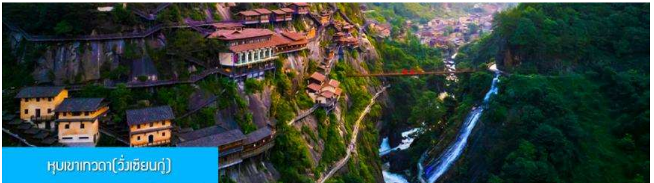
หุบเขาเทวดา(ว่างเซียนกู่)

หลังอาหารนำท่านเดินทางสู่เมือง ชั่งเหลา 上饶 (ระยะทาง 127 กม. ใช้เวลาเดินทางโดยรถบัสราว 2 ชั่วโมง)