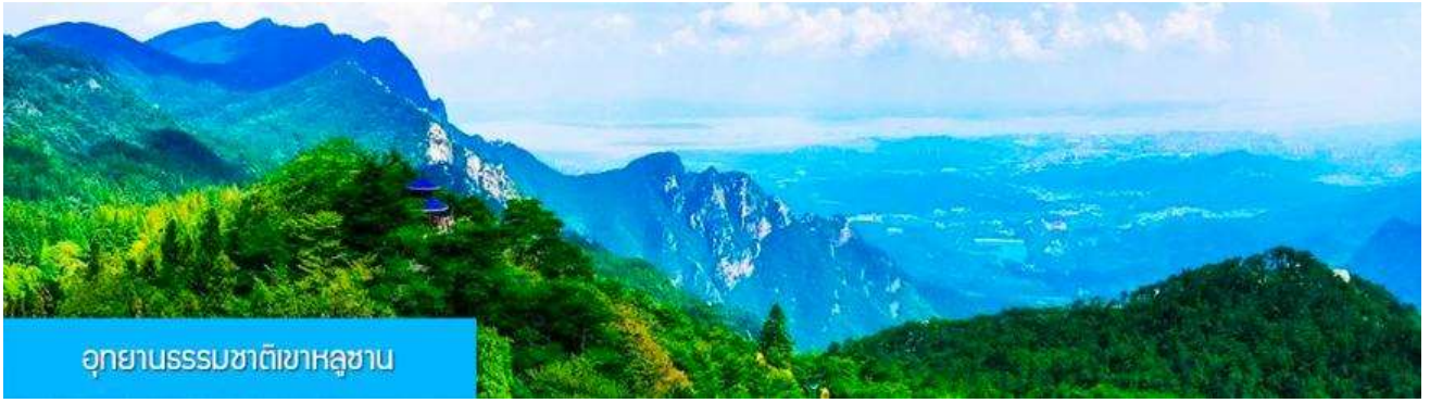
อุทยานธรรมชาติเขาหลูซาน