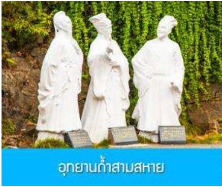
อุทยานก้าสามสหาย