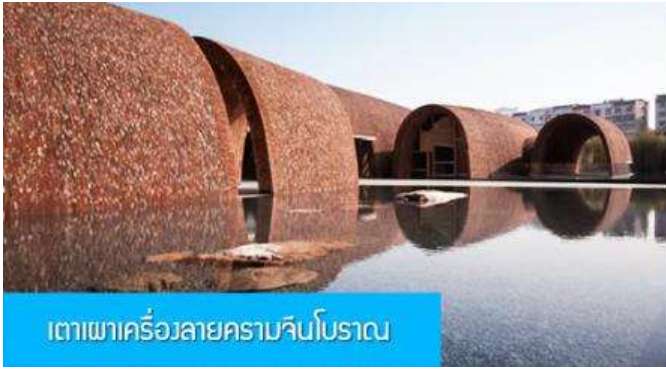
เตาเผาเครื่องลายครามจีนโบราณ