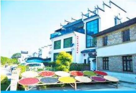
หมู่บ้านโบราณ สือเหมินซุน