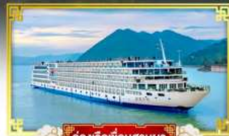
ล่องเรือเขื่อนสามผา