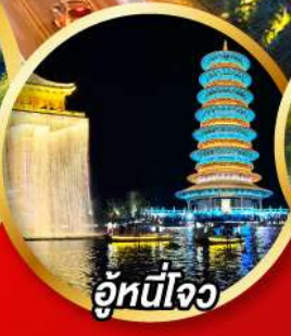
อู้หึงใจ