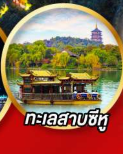
ทะเลสาบซีหู