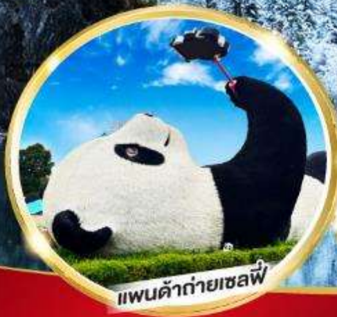
แพนด้ายักษ์เซลฟี

หมี่แพนด้ายักษ์ ช้อปปิ้ง POP MART 5วัน 4คืน