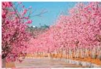
หุบเขายาคุระ