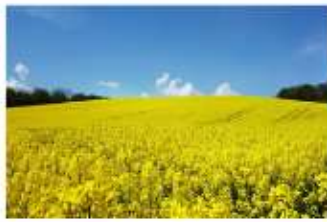
ทุ่งดอกเบญจมาศ