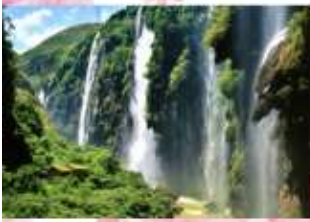
ปัทมกร้อยสาย