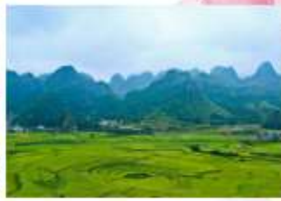
ป่าภูเขาหมื่นยอด