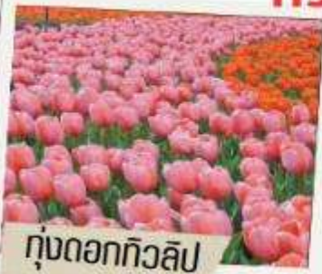
ทุ่งดอกทิวลิป