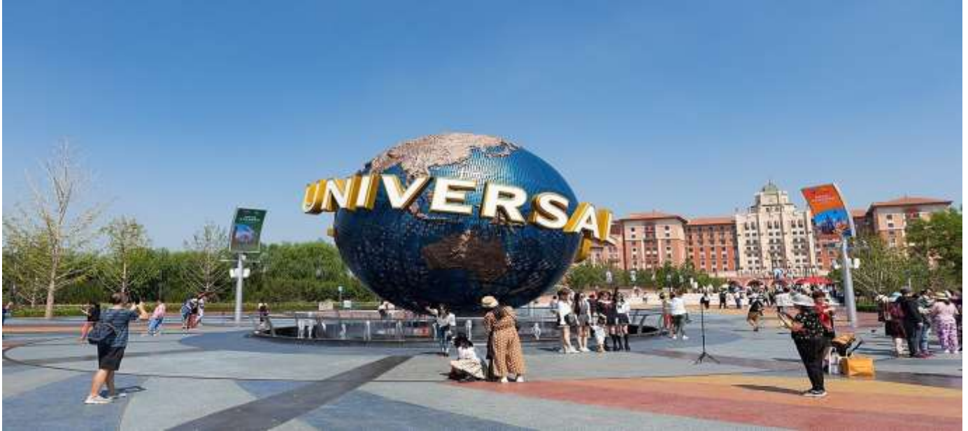
ที่พัก LeafIN HOTEL BEIJING หรือเทียบเท่า

อิสระอาหารกลางวัน และค่า ไม่รวมอยู่ในรายการ