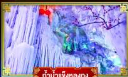
ถ้ำน้ำแข็งหลงกง

"เที่ยว 2 มณฑล กวางซี-กัชโจว" สุดอลังการ น้ำตก 2 พรมแดน แหล่งท่องเที่ยวระดับ 5A