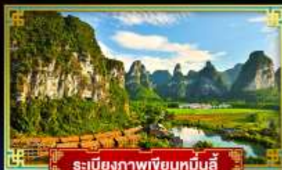
ระเบียบภาพเขียนหมินอี