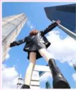
3 ตึกใหญ่ แห่งเมือง เซียงไฮ้