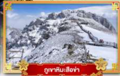
ภูเขาหิมะ-ซือซ่า