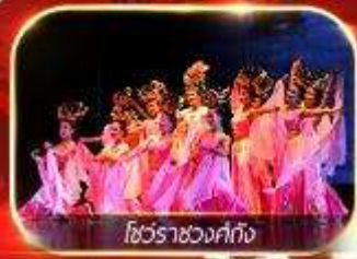
โชว์ราชวงศ์ถัง

สัมผัสความยิ่งใหญ่ อนุสาวรีย์ทหารกล้าจีน นั่งรถไฟความเร็วสูง ทะลุเมืองโบราณ ย้อนตำนานประวัติศาสตร์จีน