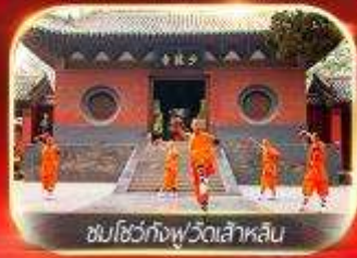
ชมโชว์กังฟูวัดเส้าหลิน