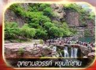
อุทยานลั่วหยาง หุยงโกซาน