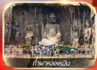
ถ้ำพาล่งเหมิน