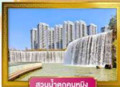
สวนน้ำตกคุนหมิง