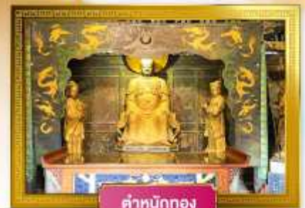
ตำหนักทอง