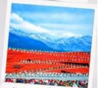
โชว์ จางอีโหมว