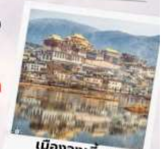
เมืองจางเตียน เซียงกรีล่า