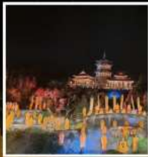
โชว์ SHAOLIN MUSIC CEREMONY