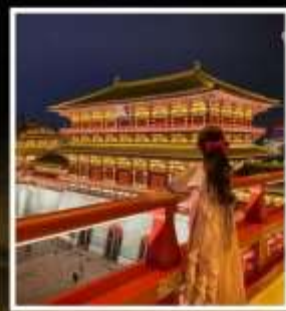
ท่าแพงอังก์เทียนเหมิน