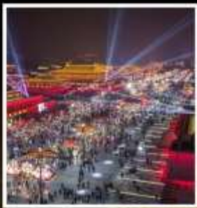
ถนนคนเดินวัฒนธรรมต้าถิง