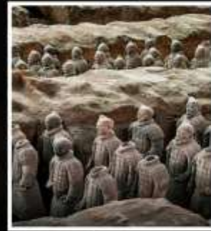
พิพิธภัณฑ์กองทัพใต้ดิน ทหารม้าจีนซี