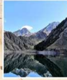
ทะเลสาบเทียนฉือ