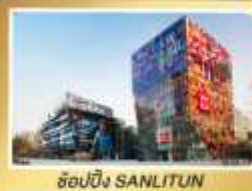
ช้อปปิ้ง SANLITUN