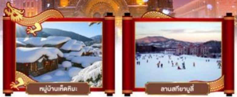
หมู่บ้านหิมะหิมะ:

• มหัศจรรย์ดินแดนกุหลาบ หมู่บ้านหิมะแห่งความฝัน