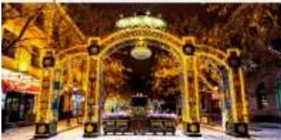
ถนนคนเดินจงหยาง