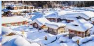
หมู่บ้านหิมะ

*ทางบริษัทฯ ขอสงวนสิทธิ์ในการปรับเปลี่ยนโปรแกรมทัวร์ตามความเหมาะสมขึ้นอยู่กับสถานการณ์ปัจจุบัน โดยคำนึงถึงผลประโยชน์ของลูกค้าเป็นสำคัญ