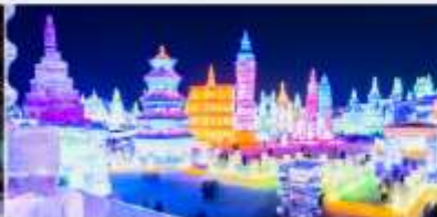
เทศกาลโคมไฟน้ำแข็ง