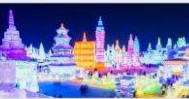
เทศกาลโคมไฟน้ำแข็ง