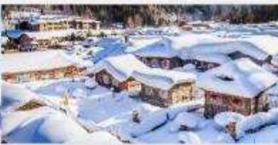
หมู่บ้านหิมะ