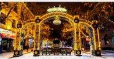
ถนนคนเดินจงหยาง