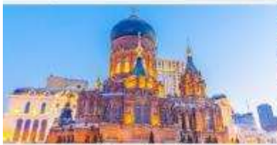
โบสถ์เซนต์โซเฟีย