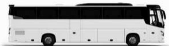
ตัวอย่างรถทัวร์ 1 คัน

ค่าที่พักตามที่ระบุในรายการหรือเทียบเท่าระดับเดียวกัน (พักห้องละ 2 ท่าน) หากประเภทห้องพักท่านริควงมาเป็นอีก เช่น ริควงห้องพักเป็น TWIN BED หรือ DOUBLE BED ทางบริษัทขอสงวนสิทธิ์ในการปรับประเภทห้องพัก เป็นตามที่โรงแรมมีอยู่ โดยไม่ต้องแจ้งให้ทราบล่วงหน้า