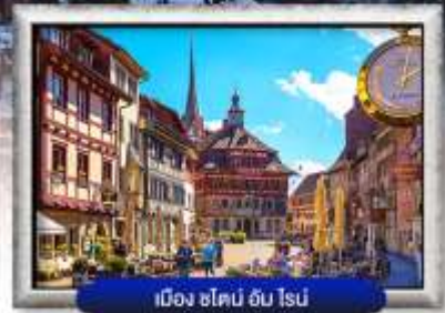
เมือง ซ็ไตน์ อัม ไรน์