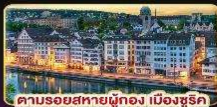
ตามรอยสหราชอาณาจักร เมืองซูริค