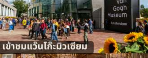
เข้าชมแวนโก๊ะมิวเซียม