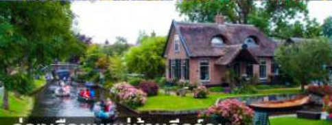
ล่องเรือชมหมู่บ้านกีร์รุน

สายการบินการตาร์แอร์เวย์ บินเข้า อัมสเตอร์ดัม บินออก ปารีส น้ำหนักกระเป๋า 25 กก.