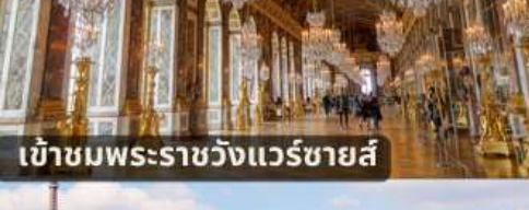
เข้าชมพระราชวังแวร์ซายส์