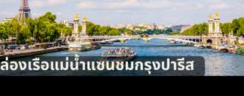
ล่องเรือแม่น้ำแซนชมกรุงปารีส