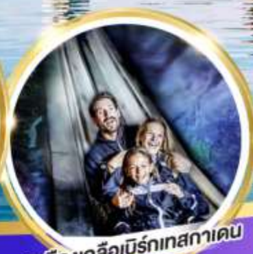
เหมืองเกลือบิรท์เทศกาเดิน