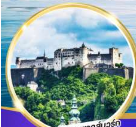
ปราสาทไฮเซนซาลส์บวร์ก