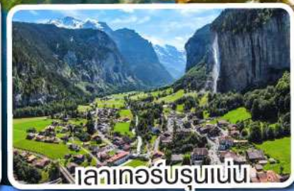
เลาเคอร์บรุนเนน