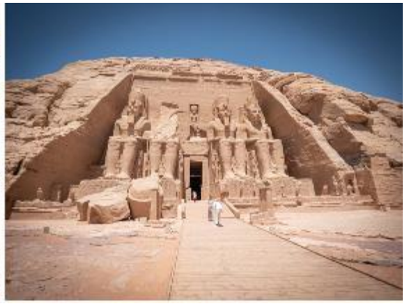
สมควรแก่เวลานำท่านเดินทางกลับเมืองอัสวาน