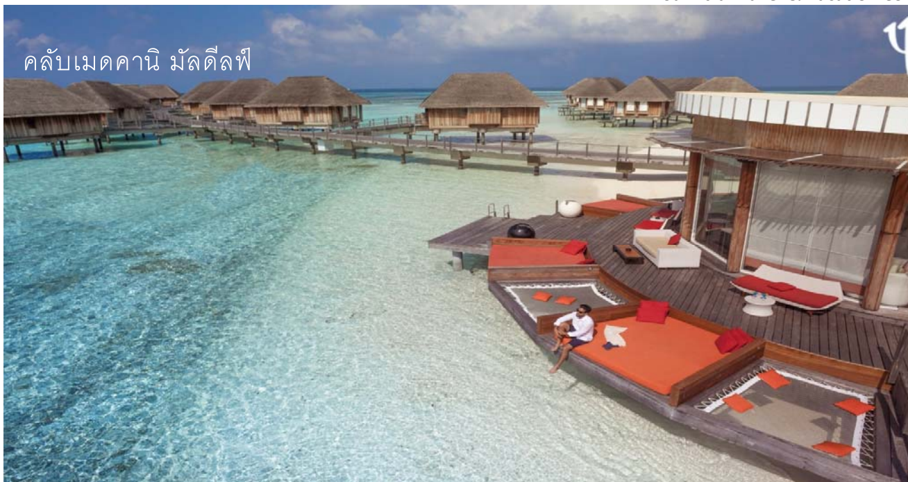
คลับเมดคานี มัลดีฟส์