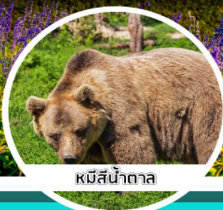
หมีสีน้ำตาล