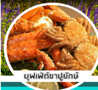
บุฟเฟ่ต์ชาบูยักษ์